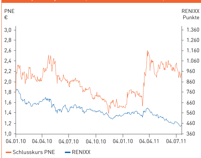
Aktienkurs, Handelsplatz XETRA (4. Januar 2010 bis 22. Juli 2011)